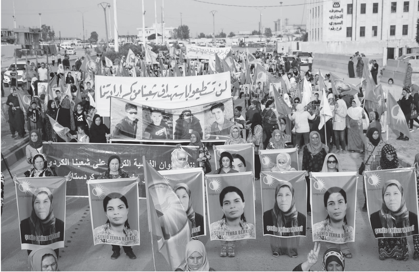
Helincê köyündeki katliam protesto edildi | Kobanê - 28 Haziran 2020

ını artırmıştır. Hakim sınıf sözcüleri ne zaman “biz Kürtlerle etle tırnak gibiyiz” açıklaması yapsalar arkasından yeni bir saldırganlık konsepti devreye sokmuşlardır.