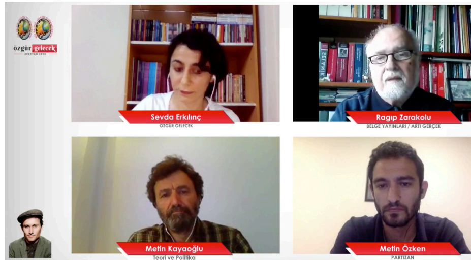
Kaypakkaya'da Değişimin Dinamiği Ve Devrimin Güncelliği Önder İbrahim Kaypakkaya'yı anmaya çağırıldı. Komünist önder İbrahim Kaypakkaya